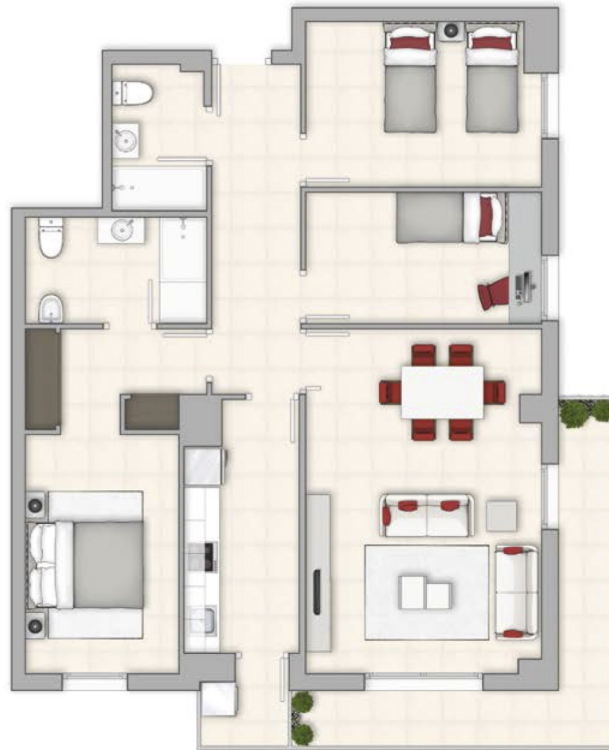
Vivienda tipo 3 dormitorios Superficie Construida 117m 2