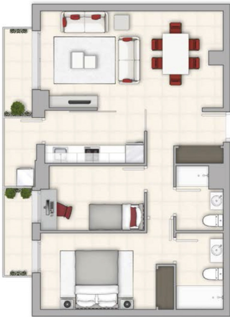
Vivienda tipo 2 dormitorios Superficie Construida 84m 2

Calidad y diseño funcional Innovación y sobre todo compromiso con tu nuevo estilo de vida